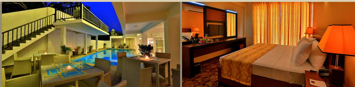
Photos de chambres non contractuelles

✉ Anuradhapura Road, Habarana e http://danawwaresort.com/