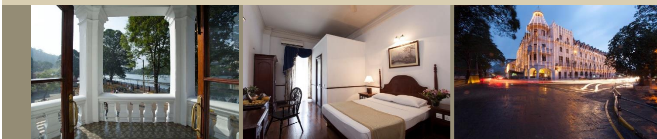
Photos de chambres non contractuelles