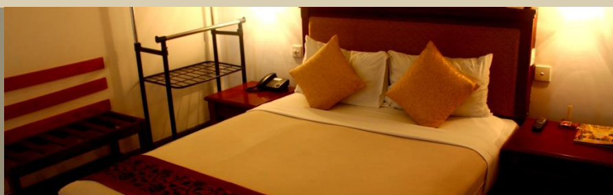
Photos de chambres non contractuelles

✉ No 75 Welimada Road, Haputale, e http://www.olympusplazahotel.com/